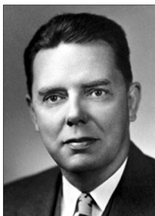
Figura 1 - Philip Showalter Hench (1896-1965).