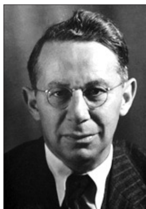
Figura 3 - Tadeusz Reichstein (1897-1996).