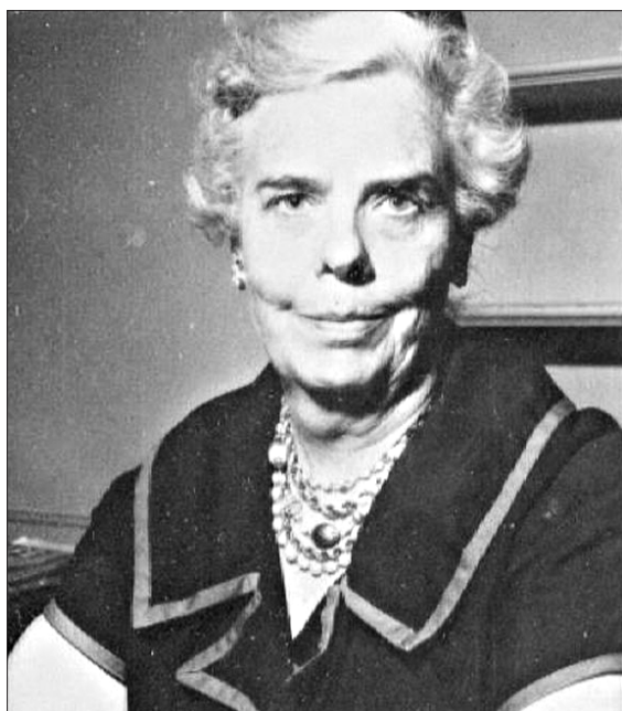
Figura 3 - Janet G. Travell (1901-1997).

tivamente la sostanziale identità fra il reumatismo muscolare descritto dagli autori tedeschi e la fibrosite. L'esistenza di noduli fibrositici venne in seguito completamente ridimensionata, tant'è che nel 1936 l'équipe della Mayo Clinic coordinata da Philip Showalter Hench concluse che questi erano accessibili solo al finger of faith .