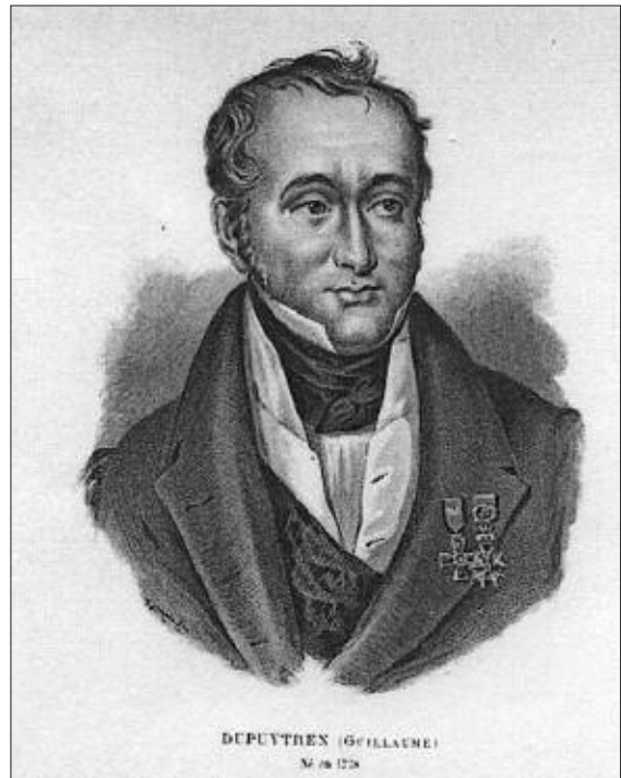
Figura 1 - Ritratto di Guillaume Dupuytren (1777-1835).

ambito di anatomia e fisiologia. Lo stesso Bichat gli suggerì di iscriversi alla Société Médicale d'Emulation , che raggruppava i nomi più celebri della medicina parigina di quel tempo, fra i quali Dominique-Jean Larrey (1766-1842), Antoine Portal (1742-1832), Philippe Pinel (1745-1826), Jean-Nicolas Corvisart (1755-1821). Il periodo della sua formazione durò sette anni, dopodiché divenne so-